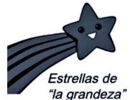
Estrellas de “la grandeza”