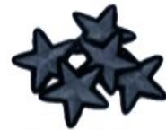
Estrellas “del montón”