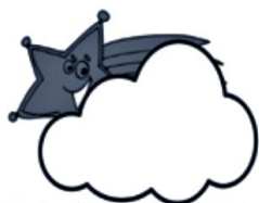
Estrellas "de luz interior"

(Puede proyectarse el power point "Tercera Semana de Adviento", con los dibujos, e invitaciones de las diferentes estrellas. Pedirlo a jlsabo@salterrae.es.)