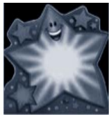
Estrellas “del brillo”